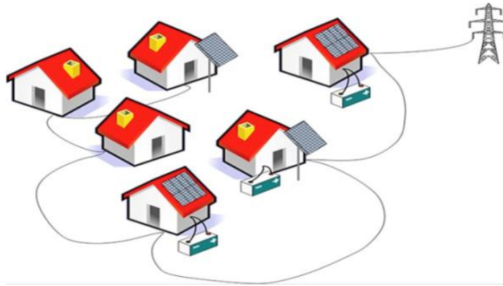
Նկար 2. Վիրտուալ էլեկտրակայան. ծրագրին մասնակից տնային տնտեսությունների մարտկոցների միջոցով ավելցուկային արևային էներգիայի պահեստավորում և վաճառք