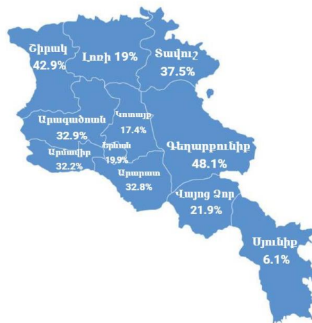
Աղքատության մակարդակը Հայաստանում 2020 թվականին՝ ըստ մարզերի և Երևանի

Աղքատության ամենացածր մակարդակը Սյունիքում է (տե՛ս ինֆոգրաֆիկան):